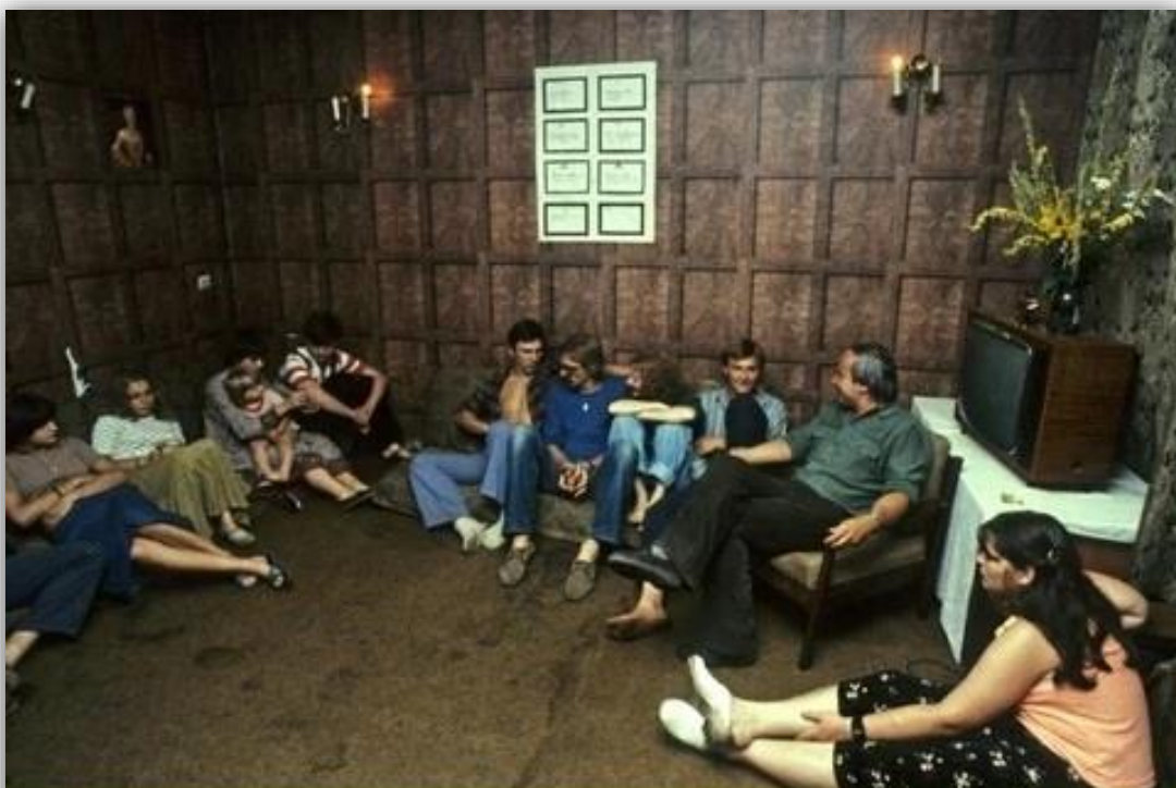
Zebranie w Monarzu w Głoskowie, 1982