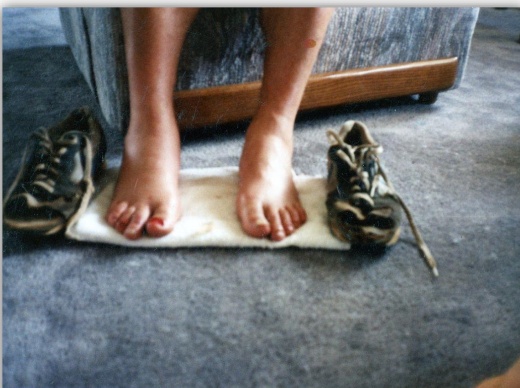
Stopy Jerzego Góreckiego dwa dni po Biegu Śmierci - opuchnięte stopy i palce, z których zeszły wszystkie paznokcie.