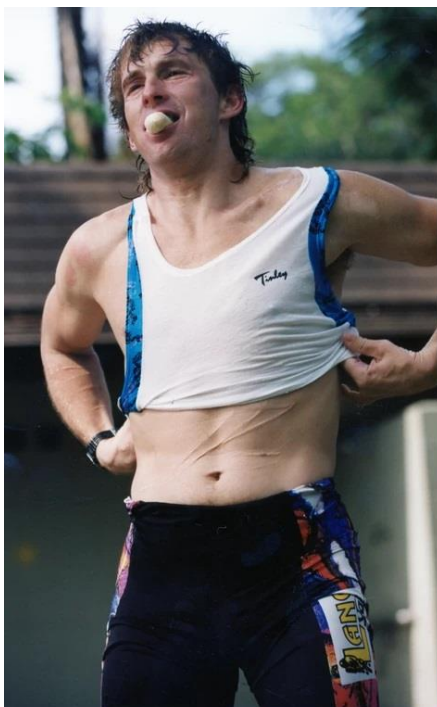
Ultraman na Hawajach w 1995 roku. Na brzuchu i przedramionach widać blizny po cięciach żyłką i nożem.