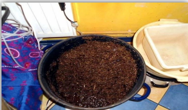
wywar ze słomy makowej

Po dwunastu latach ćpania jego organizm uodpornił się na potężne dawki narkotyków. W żyłę strzykiwał sobie aż dwadzieścia centymetrów heroiny dziennie. Palił prawie sto papierosów dziennie. Ważył niespełna pięćdziesiąt kilogramów, był cały w bliznach. Robił "połyki"- wiązał ostre przedmioty nicią, które później spuszczał w dół przetyku i prosił o