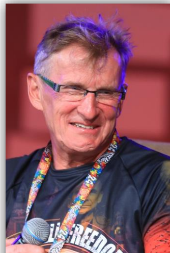
Jerzy Górski na Pol'and'Rock Festival w 2018 r.